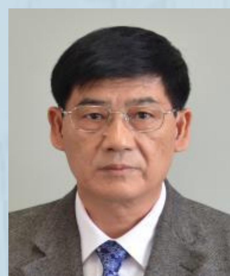
刘文清 院士 中国科学院安徽光机所 Plenary talk: Spectroscopy Technology in Air Pollution Monitoring