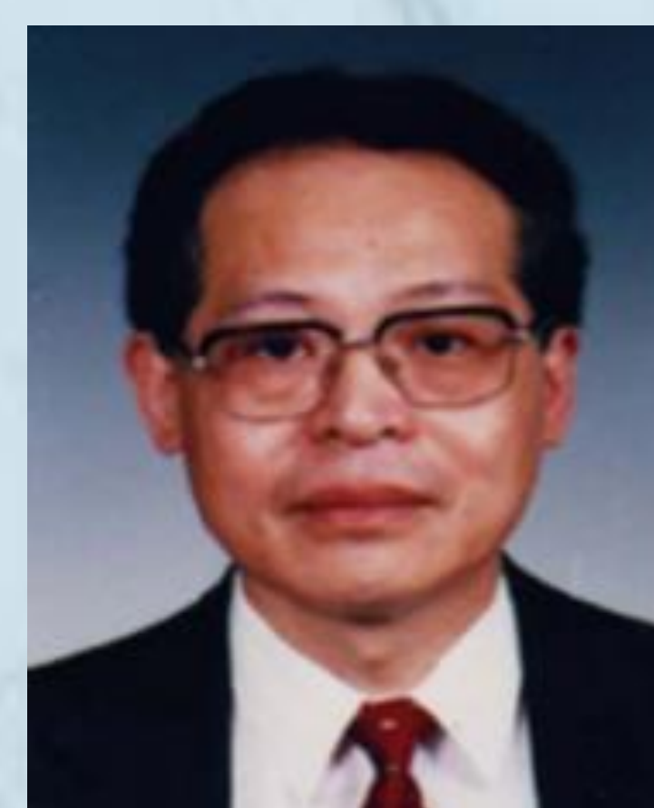
庄松林 院士 上海理工大学 Plenary talk: Metasurface-based THz polarization manipulating and high-resolution imaging